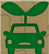
排気ガスを抑えて